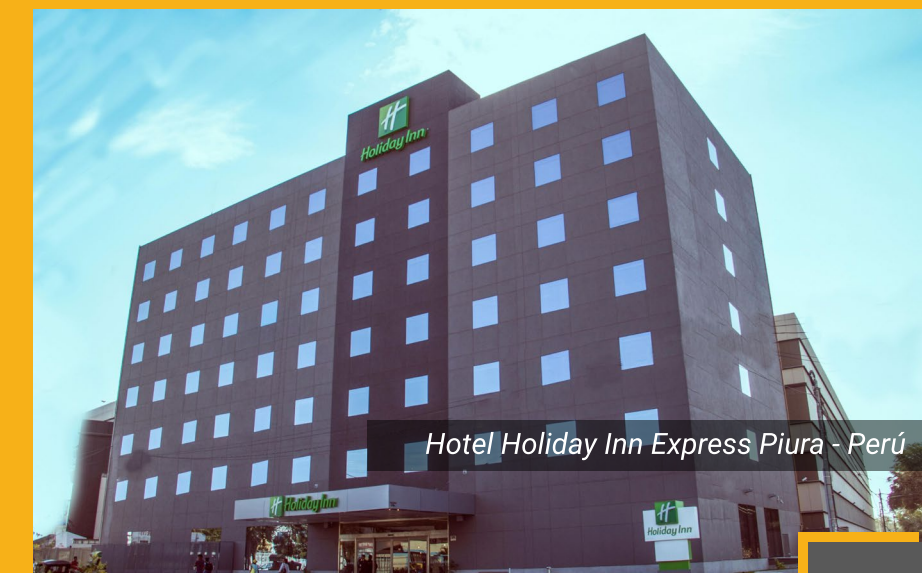
Hotel Holiday Inn Express Piura - Perú