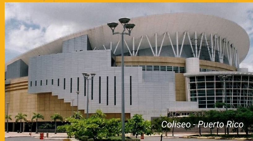
Coliseo - Puerto Rico