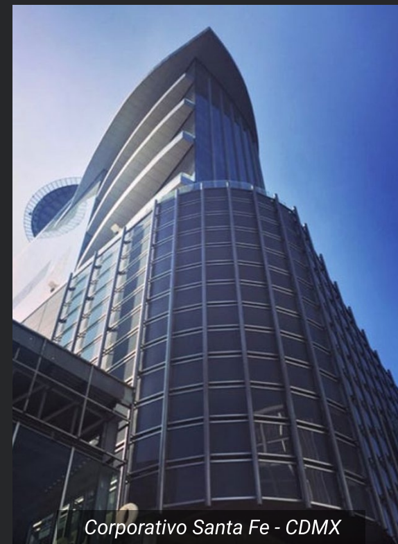
Corporativo Santa Fe - CDMX

Diseñamos proyectos que se adaptan a las necesidades comerciales modernas, incorporando soluciones flexibles para el espacio.