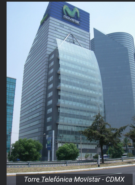
Torre Telefónica Movistar - CDMX