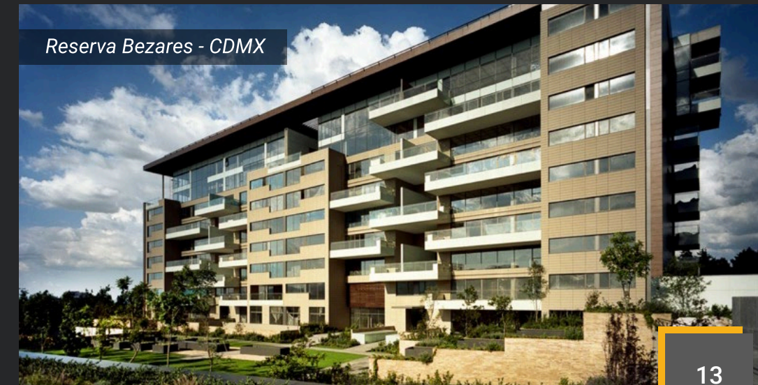
Reserva Bezares - CDMX