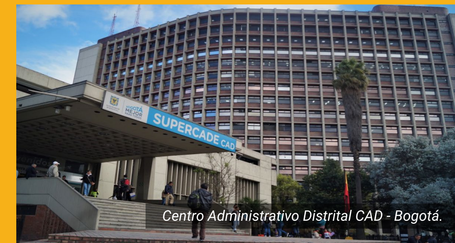
Centro Administrativo Distrital CAD - Bogotá.

Nos apegamos a normativas y condiciones locales en el desarrollo de proyectos, en cualquier contexto a nivel internacional.