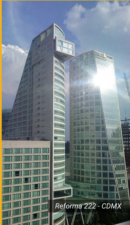
Reforma 222 - CDMX

Diseñamos edificios de 60 metros de altura en adelante, garantizando la estabilidad y seguridad en condiciones adversas.