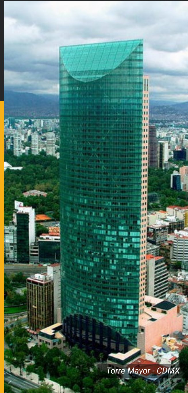
Torre Mayor - CDMX