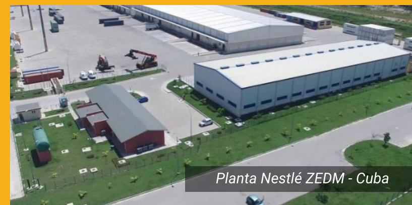
Planta Nestlé ZEDM - Cuba