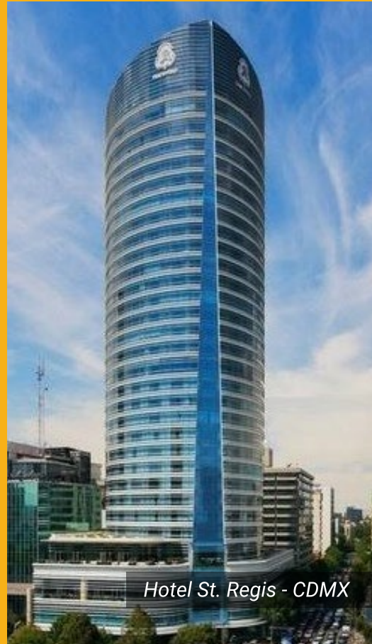
Hotel St. Regis - CDMX