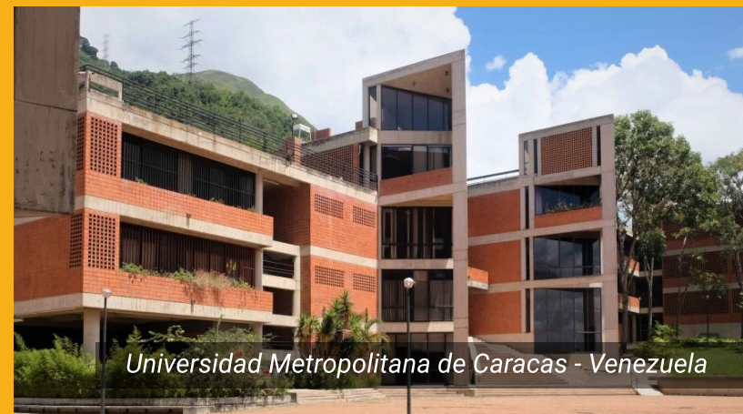
Universidad Metropolitana de Caracas - Venezuela