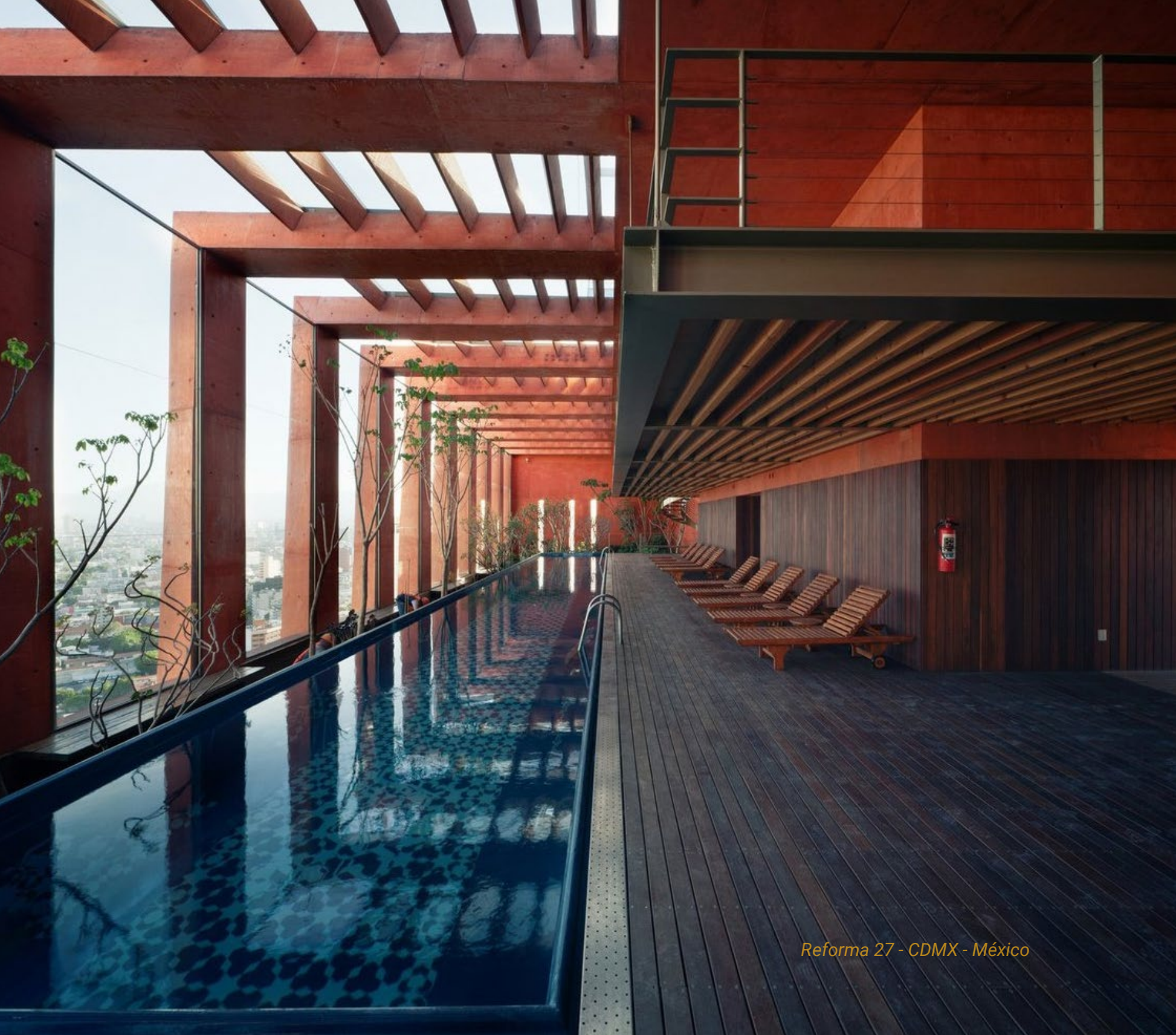
Reforma 27 - CDMX - México