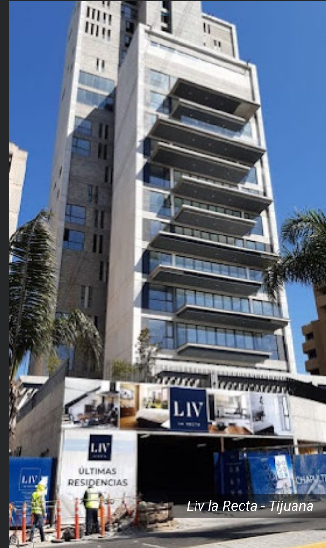
Liv la Recta - Tijuana

Desde casas unifamiliares hasta complejos habitacionales, creamos espacios seguros y confortables.