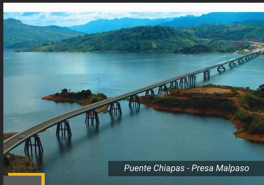
Puente Chiapas - Presa Malpaso