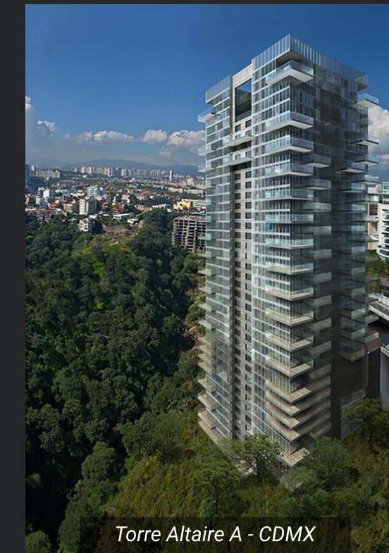
Torre Altaire A - CDMX