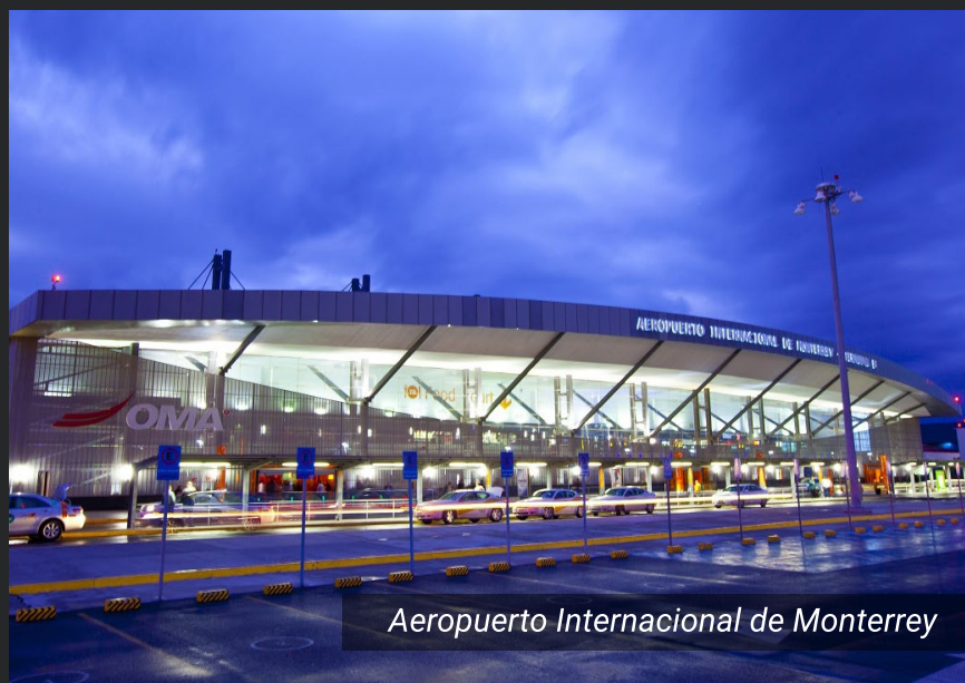
Aeropuerto Internacional de Monterrey